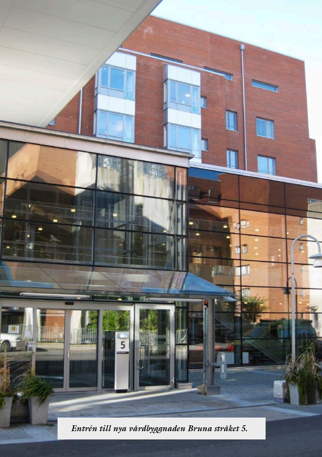
Entrén till nya vårdbyggnaden Bruna stråket 5.